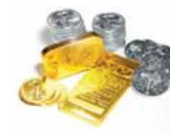
MÉTAUX PRÉCIEUX Or, Argent, Platine