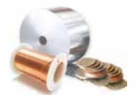
MÉTAUX NON PRÉCIEUX Aluminium, Cuivre, Nickel, Zinc