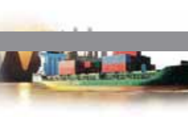
AUTRES Crédits carbonés, Fret