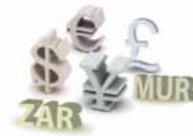
DEVICES EUR/USD, GBP/USD, JPY/USD, CHF/USD, ZAR/USD, MUR/USD, KES/USD, UGX/USD

Les contrats sont cotés en dollars américains sur un marché ouvert du lundi au vendredi, sauf les jours fériés boursiers.