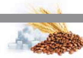
PRODUITS AGRICOLES Café, Sucre, Blé, Maïs