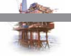
ENERGIES Gaz Naturel, Pétrole Brut